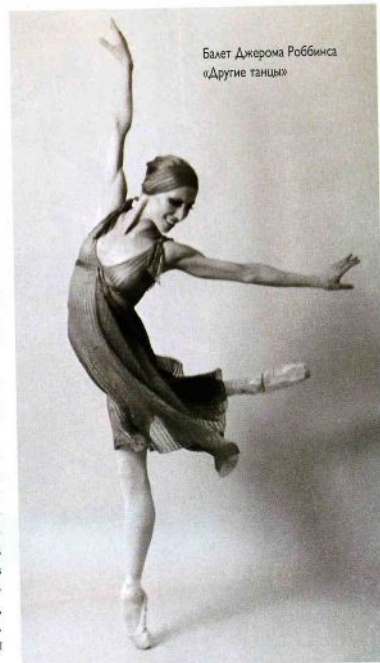
Балет Джерома Роббинса «Другие танцы»

■ Каким было ваше самое сильное балетное впечатление? – Я была потрясена, увидев, как в фильме-балете «Ромео и Джульетта» Галина Уланова в страстном порыве бежит через всю сцену к монаху Лоренцо. В этом беге стремительно двигалось все – тело и душа в одном неудержимом порыве. Эта сцена, увиденная в мои первые годы в Мариинском (тогда Кировском) театре, врезалась мне в память на всю жизнь. Вы не представляете, как трудно балеринам бегать на сцене – бежать эмоционально, красиво, страстно, выразительно и при этом не выходить из роли. Это прекрасно удавалось Улановой, и ее образ вдохновлял меня всю мою жизнь. ♡